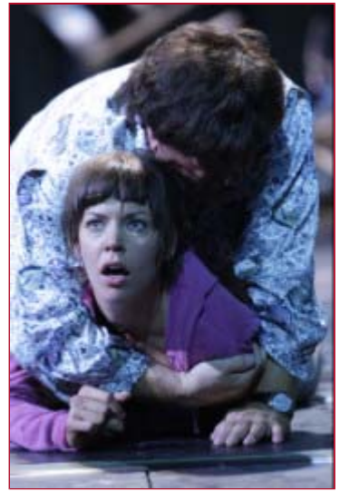
Aufgepasst: Am 13. Oktober gehts gratis ZUR SCHÖNEN AUSSICHT