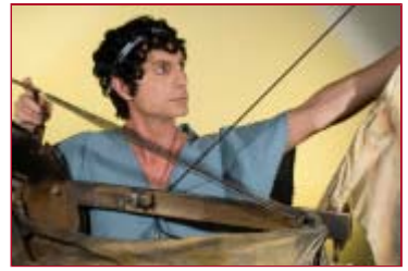
Abheben mit Ikarus

Senden Sie die richtige Antwort bitte an newsletter@buehnen-graz.com und gewinnen Sie 2x2 Karten für die Vorstellung am 15. November um 18 Uhr!