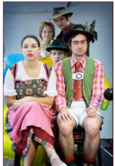
Ab 12. Oktober auf der Probebühne: DAS WETTER VOR 15 JAHREN