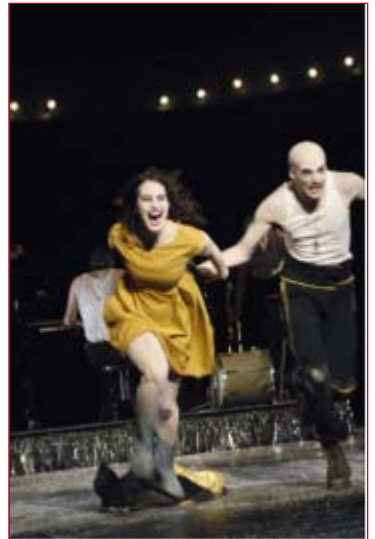
Mehr zu ALICE

Sie interessieren sich für beide Adaptionen des Büchner-Stoffes? Wir bieten Ihnen beim Kauf von Karten für das Gastspiel WOYZECK im Schauspielhaus und für WOZZECK in