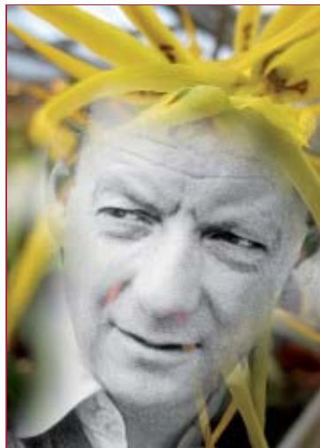
Britten für Kinder Tickets & Termine