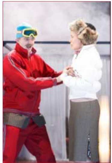
Mehr zu PYRENÄEN Tickets