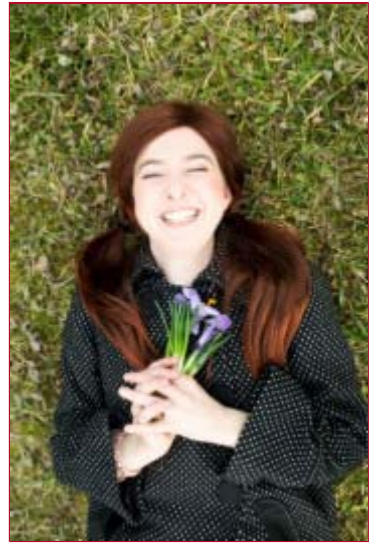
Mehr zum Stück

PREMIERE am 18. April, 17 Uhr im NEXT LIBERTY!