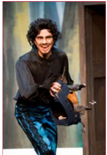
Mehr zum Stück

Im Land Nirgendwo schließt Wendy Bekanntschaft mit der winzigen und schrecklich eifersüchtigen Fee Klingklang, der toughen Tigerlilly und leider auch mit dem Piratenkapitän Haken, der Peter stets auf den Fersen ist und sich vor nichts und niemandem fürchtet – naja, außer vielleicht vor dem Krokodil, das ihm einst den Arm abgebissen hat und nun