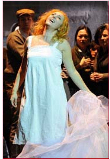
Lucia di Lammermoor Tickets & Termine

Die nächsten Vorstellungen von LUCIA DI LAMMERMOOR sind am Mittwoch, 2.4., Freitag, 4.4. und Donnerstag, 10.4., jeweils 19.30 Uhr.